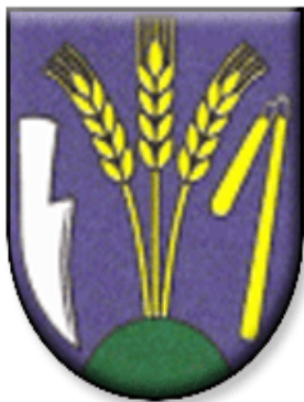
ERB obce Uňatín

Pečať Uňatína je okrúhla, uprostred s obecným symbolom a kruhopisom OBEC UŇATÍN.